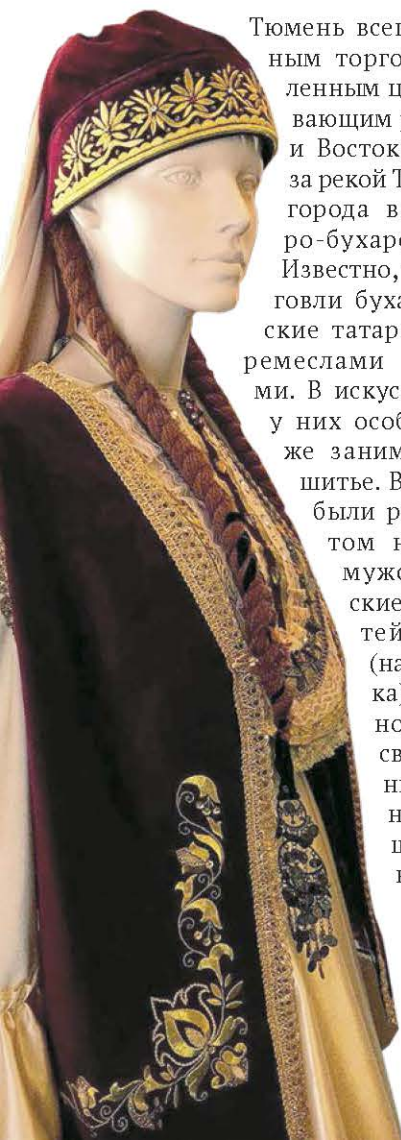
Татарский костюм Tatar Costume

Тюмень всегда была крупным торговым и ремесленным центром, связывающим рынки Европы и Востока. В XVII веке за рекой Турой напротив города возникла Татаро-бухарская слобода. Известно, что кроме торговли бухарцы и сибирские татары занимались ремеслами и промыслами. В искусстве вышивки у них особое место также занимало золотое шитье. В основном это были расшитые золотом национальные мужские и женские наряды: тубетейки, сарауцы (налобная повязка), изю (нагрудное украшение), свадебные головные покрывала, накосные украшения, сафьяновые сапоги