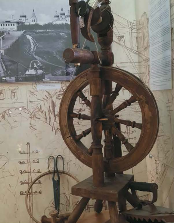
Старинные инструменты для прядения и вышивания Old tools for spinning and embroidery

plaques and tinsel braid. Goldwork thread had different weaves and shapes; it could be round in cross-section or flat, as well as faceted or twisted. A simple gold thread was too fragile for embroidery. Therefore, it was laid upon the fabric and attached to it with silk thread. Silk thread was selected to match the color of gold to create a one-color pattern, or a contrasting shade was used to get a colorful pattern. Over time, the range of products, their purpose and place, the patterns and compositions, the sizes and proportions and the artistic approach for goldwork embroidery was changing, but its special techniques remained unchanged.