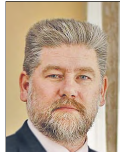
Шишкин Игорь Геннадьевич Председатель Комиссии по по гармонизации межнациональных и межрелигиозных отношений Ректор Тюменской государственной академии культуры, искусств и социальных технологий, председатель Координационного Совета национальных общественных объединений и национально-культурных автономий Тюменской области.