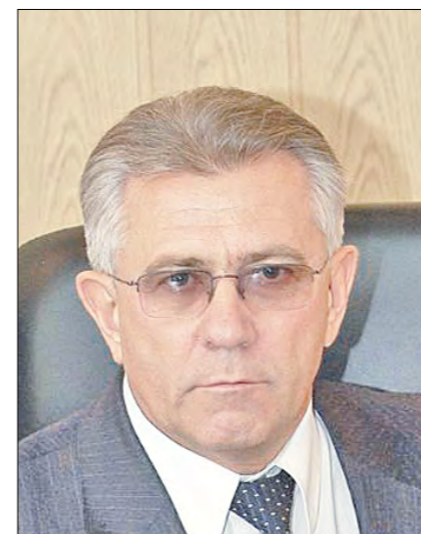
Кашуба Эдуард Алексеевич Председатель Комиссии по образованию, науке, культуре и туризму, Советник ректора Федерального государственного бюджетного образовательного учреждения высшего образования «Тюменский государственный медицинский университет» Минздрава России, Заслуженный деятель науки Российской Федерации.