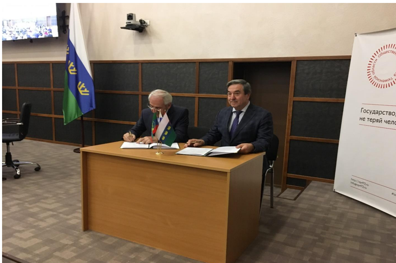
Подписание Соглашения между Общественной палатой Тюменской области и Общественной палатой Республики Дагестан.