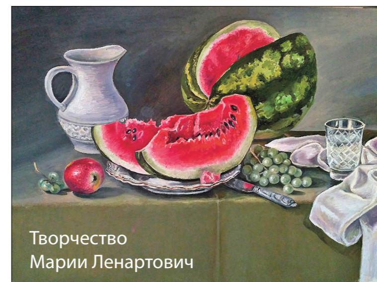
Творчество Марии Ленартович

под руководством профессиональных тренеров, попытаться освоить разнообразные фигурные элементы, изучить прыжки и вращения и конечно же пройти технику безопасности на льду. Тренировки включают в себя физическую подготовку в зале (ОФП, растяжка, отработка прыжковых элементов) и, конечно же, сам лёд, что позволяет вам укрепить физическую форму. На льду группы делятся по уровню катания (новички и старички), и каждый получает именно те упражнения, которые подходят персонально, даже если вы пришли первый раз!