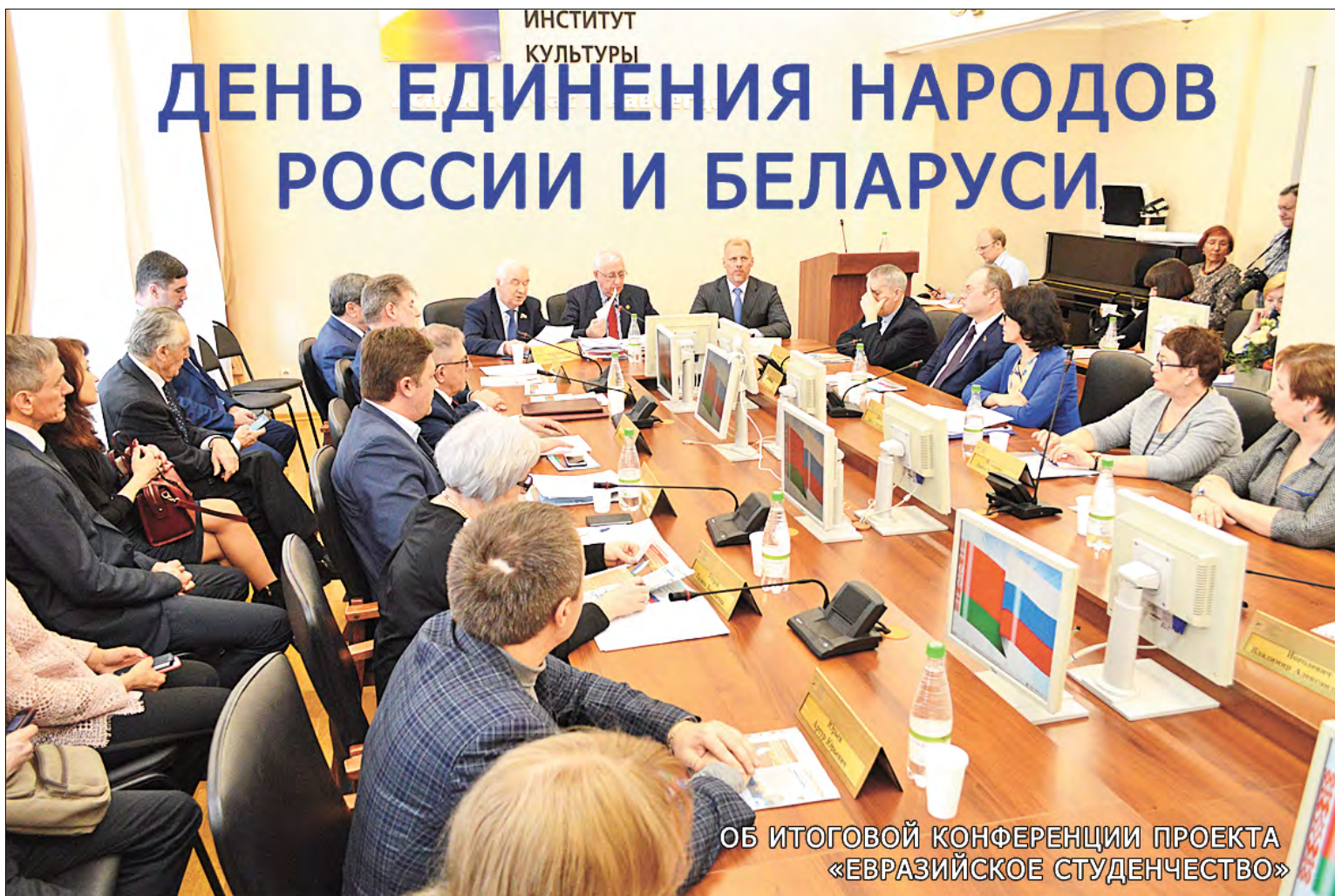
ОБ ИТОГОВОЙ КОНФЕРЕНЦИИ ПРОЕКТА «ЕВРАЗИЙСКОЕ СТУДЕНЧЕСТВО»

30 марта 2018 года в Тюменском государственном институте культуры под эгидой комиссии по развитию общественной дипломатии и работе с соотечественниками Общественной палаты Тюменской области совместно с Тюменской областной общественной организацией «Союз – интеграция братских народов» была проведена итоговая конференция проекта «Евразийское студенчество». Мероприятие проходило в рамках Торжественного собрания, посвященного Дню единения народов России и Беларуси.