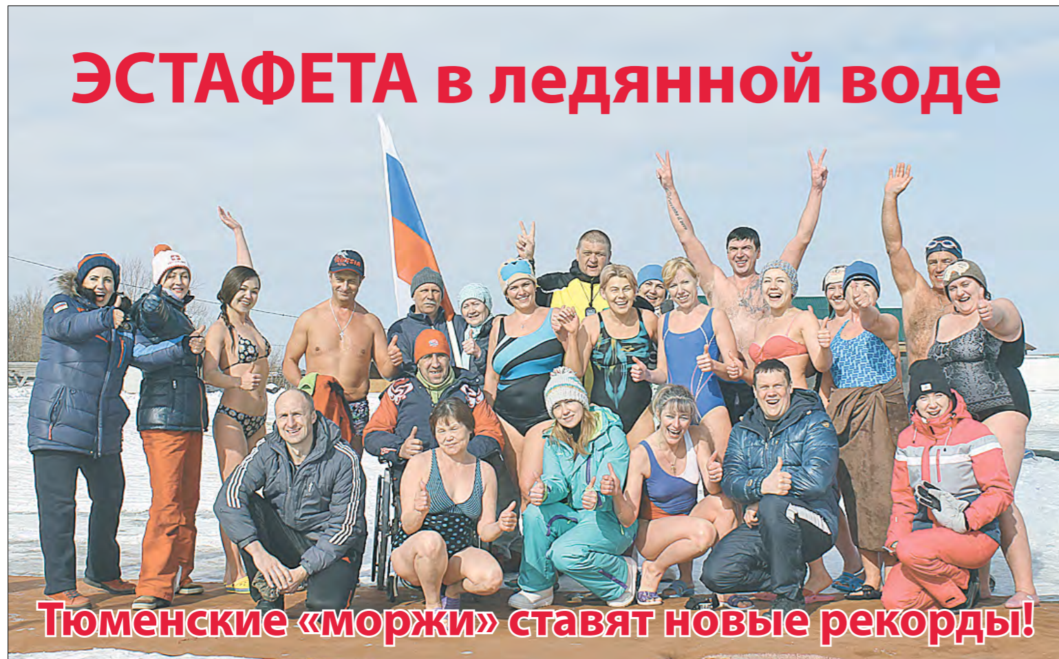
Тюменские «моржи» ставят новые рекорды!

На территории нашей базы провели электричество, несмо-