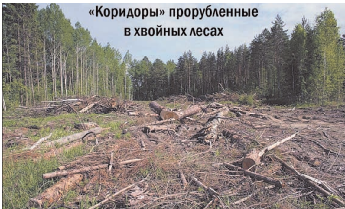
«Коридоры» прорубленные в хвойных лесах

Разработке песчаных залежей должны предшествовать детальные изыскательские работы на всех территориях, предполагаемых к эксплуатации в ближайшие 5 лет. Проекты заготовки грунтов, технического и биологического этапов рекультивационных работ следует обязательно согласовывать с Департаментами лесных комплексов и Общественными палатами субъектов РФ. К проектам следует прилагать фотографии исходных лесных участков, материалы изыскательских шурфов, показывающие толщину песчаных залежей и уровень грунтовых вод в поздневесенний (май–июнь) и межлетний (июль–август) перио-