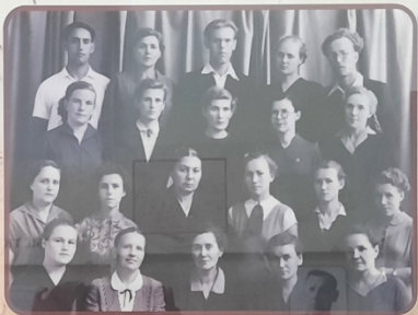
Первые воспитанники школы интерната №1 (1957 г.)

РЕШЕНИЕ Исполнительного комитета Государственного комитета от 1957 года Исполнительный комитет Государственного комитета постановляет: 1. Утвердить решение Государственного комитета от 1957 года. 2. Поручить Министерству просвещения СССР исполнить решение Государственного комитета. 3. Поручить Министерству просвещения СССР исполнить решение Государственного комитета. 4. Поручить Министерству просвещения СССР исполнить решение Государственного комитета.