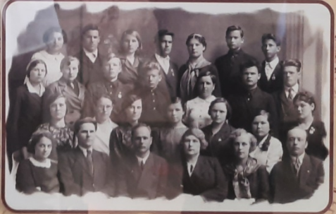
Состав преподавателей Тюменского университета. Фотография сделана в 1939 году.