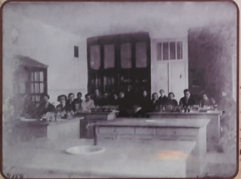
Студенты агроинженерского института на занятиях в аудитории. Фотография сделана в 1931 году.