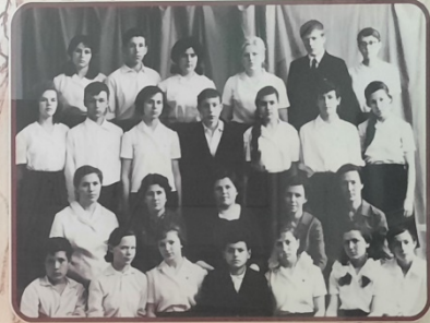
Первые воспитанники школы интерната №1 (1961 г.)